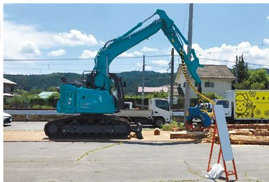
群馬原町駅北口広場周辺において作業実演するハーベスター

令和6年8月10日群馬原町駅北口広場周辺で、東吾妻町が主催する農林業マルシェが開催されました。当組合では、立木の伐倒から枝払い、測尺、玉切りまで作業する高性能林業機械ハーベスターの実演として参加しました。日頃、山中で活躍する高性能林業機械の技術をPRする機会となりました。