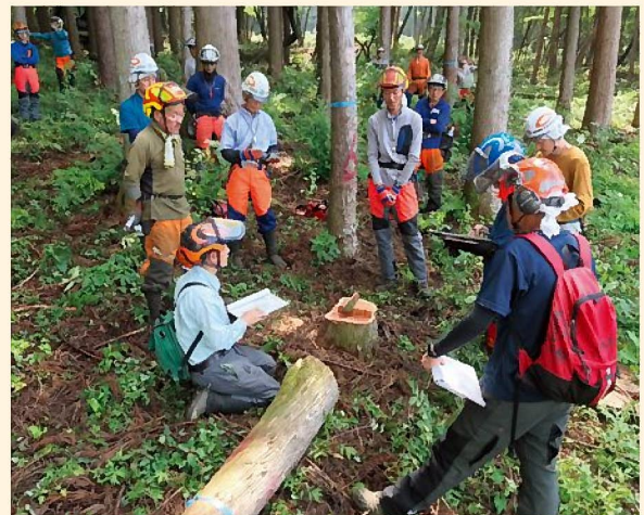
伐倒作業後に受口・追口・ツルの状況・伐倒方向等の検証