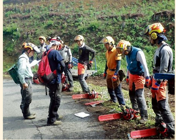
伐倒作業前に装備・安全装具・用具・チェーンソー整備状況を確認